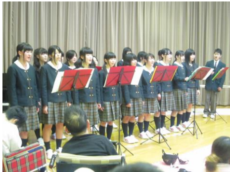
小松市立高校 芸術コースの皆様