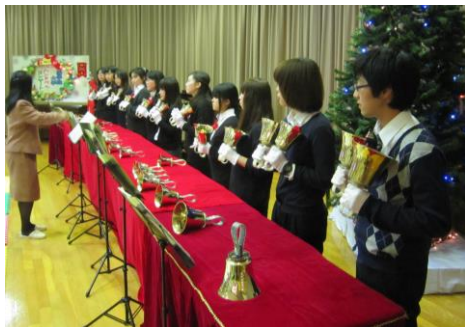
北陸学院大学 ハンドベル・リンガーズの皆様

小松療育園の中に 歌や踊り 美しい楽器の音色が響き 利用者の皆さんを 暖かく包み込みます。 素敵な癒しと たくさんのパワーを いただきました。