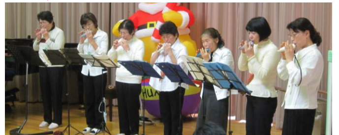
オカリナサークル 「あすなろの会」の皆様