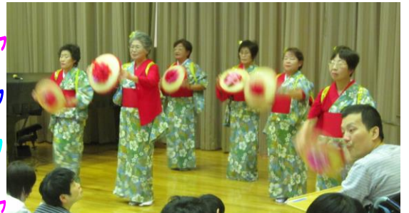
「九谷踊り子」の皆様

小松療育園の中に 歌や踊り 美しい楽器の音色が響き 利用者の皆さんを 暖かく包み込みます。 素敵な癒しと たくさんのパワーを いただきました。