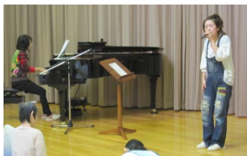
「歌夢音倶楽部」とゲストの皆様