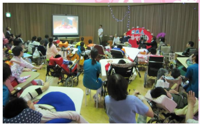
2人の小さい頃からの思い出スライドショー

今年は1歳の頃から入所されている2名の利用者のお祝いをしました。皆さんの晴れ姿にたくさんのお祝いの声が飛んでいました。駆け付けた家族の皆さんは、20年間の色々な思い出話に花を咲かせておられました。