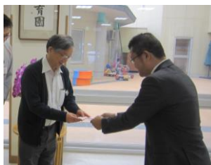
中日新聞社会事業団北陸支部様