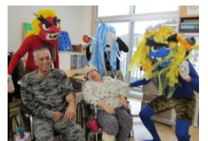
「とらい」訓練室にて