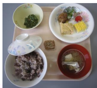
昼食の成人祝い膳