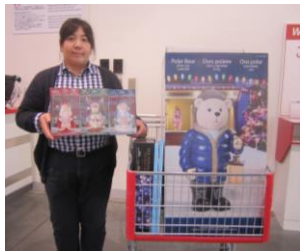
コストコホールセールジャパン(株)様