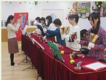
「和こう」遊戯室にて

北陸学院大学ハンドベル部の皆さんによる演奏がクリスマスのひと時を素敵に演出してくださいました。毎年ありがとうございます。