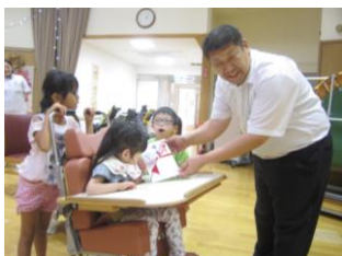
コマツユニオン北陸支部様